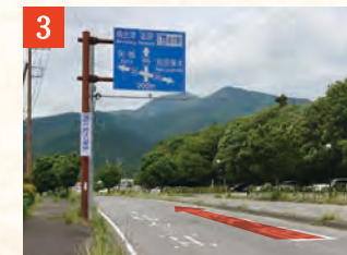
3 この先、左車線は左折専用レーンになるため、右車線を進みます。