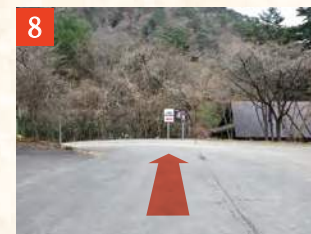
8 入口を右折進入後、突き当たりまで進みます。