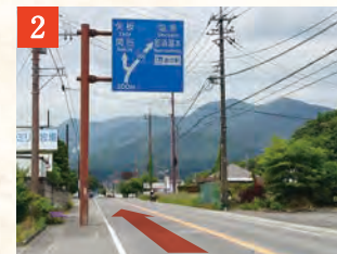
2 国道400号線を塩原・那須湯本・道の駅方面へ進みます。