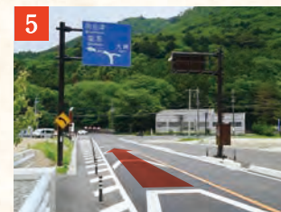
5 がま石トンネル、潜竜峡トンネルを通過し、南会津・塩原方面へ進みます。