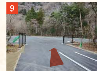
9 突き当たりを左折し、約100mほど進むと「第一駐車場」に到着です。