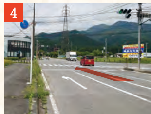
4 「関谷北」交差点を直進し、しばらく道なりに進みます。