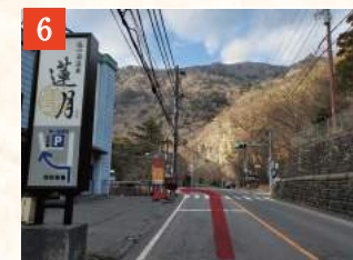
6 「福渡」交差点を左折し、福渡橋(箒川)を渡ります。