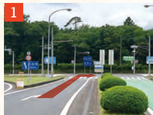
1 西那須野塩原ICを降り、料金所を通過後、突き当たりの国道400号線を右折します。

東北自動車道 西那須野塩原ICから、 塩の湯温泉 蓮月「 第一駐車場 」までのルートを ご案内いたします。